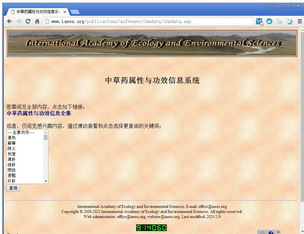
图 2 中草药属性与功效信息系统主页