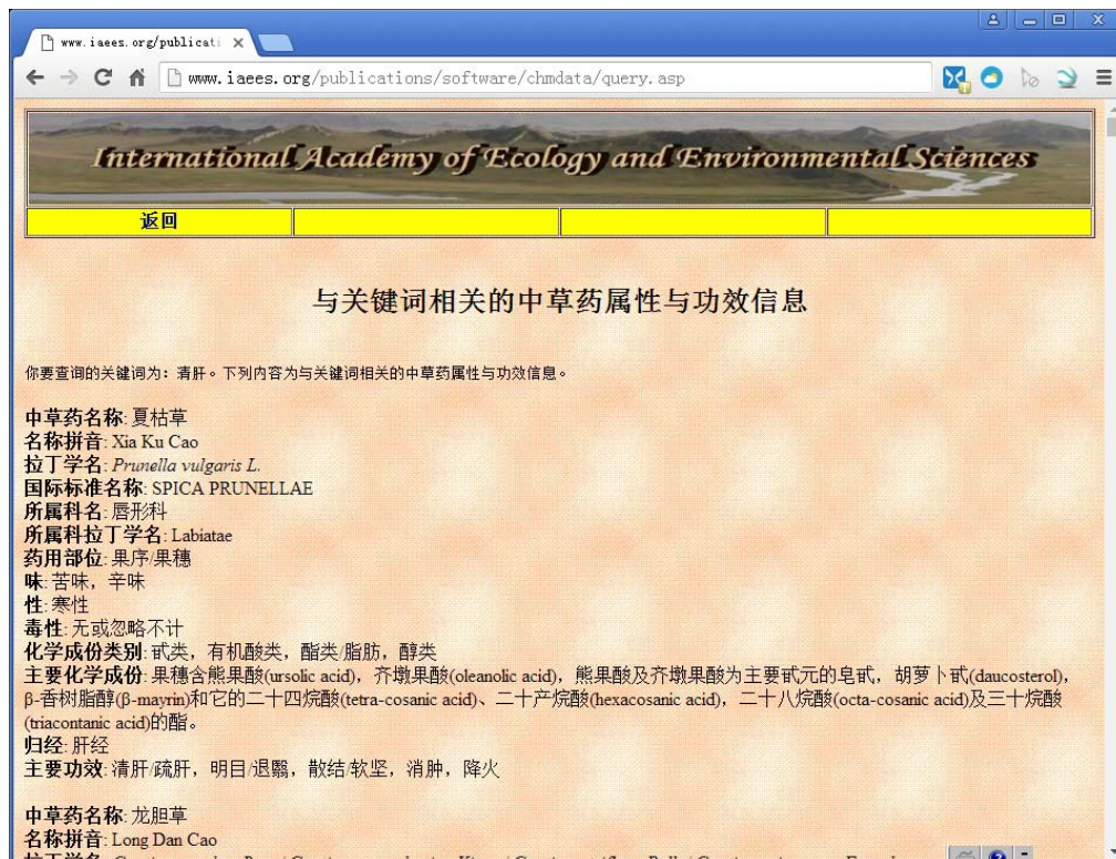
图 4 中草药属性与功效信息系统查询结果